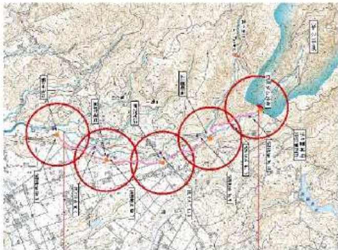
ダム下流の警報施設位置検討図