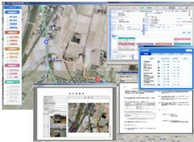
構築した施設の管理システム (オルソ画像を背景とした施設位置と各種調書)