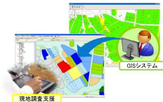
GPSを利用した現地調査支援システムと GISによる管理システム