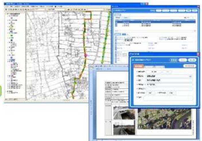
パイプラインの施設管理システム