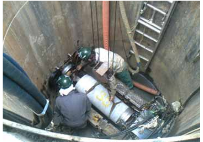
下水管路の施工状況