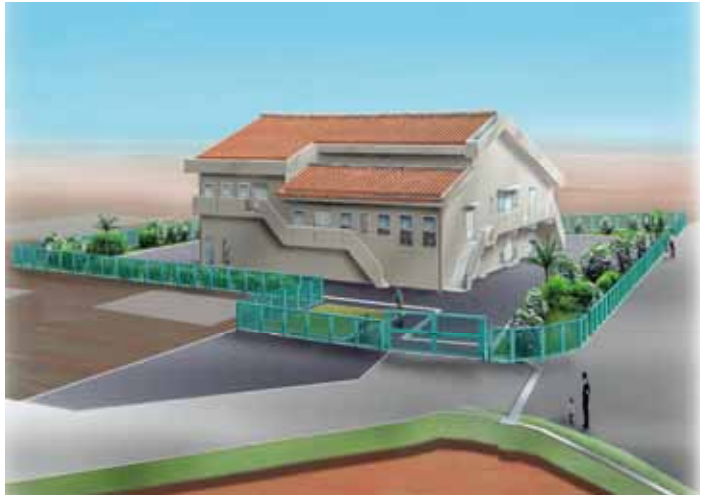
農業集落排水の污水处理場完成イメージ