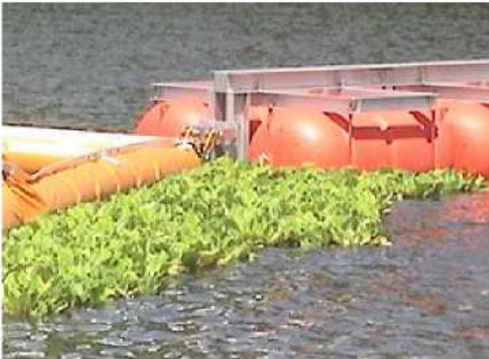
湖面に繁茂しているボタン浮き草