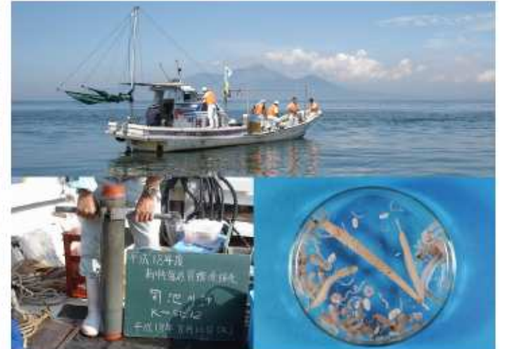
低質の調査状況と採取された生物