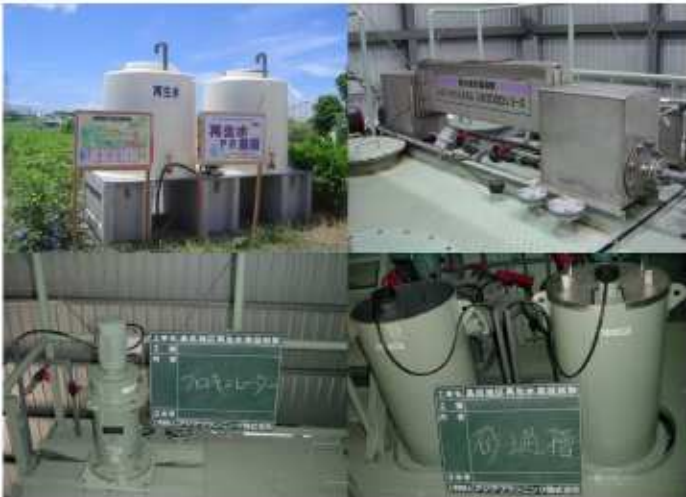
下水再生水実証利用と試験プラント